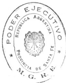
HERMES JUAN BINNER GOBERNADOR DE SANTA FE